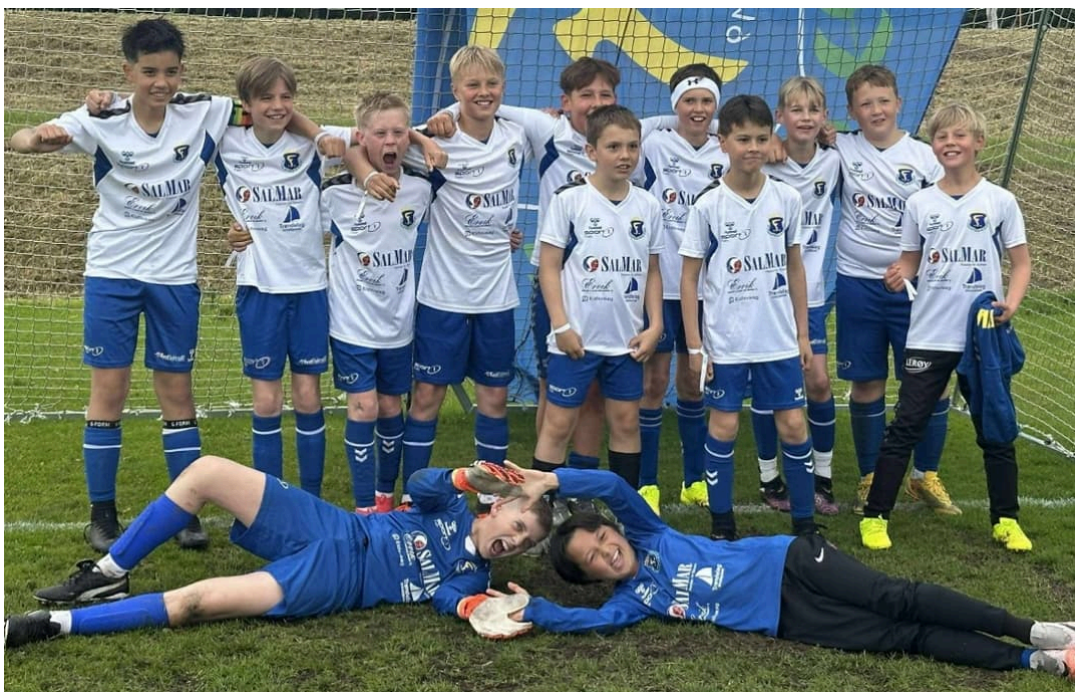
På bildet ser vi laget til Frøya IL G12 på Storsjøcup 2025

Frøya Idrettslag sender sine ungdommer til StorsjøCup eller Norway Cup hvert år. Idrettslaget har i dag 450 medlemmer, og Trøndelag Sparebank er stolt sponsor av en klubb med stadig økende medlemmer og antall lag.